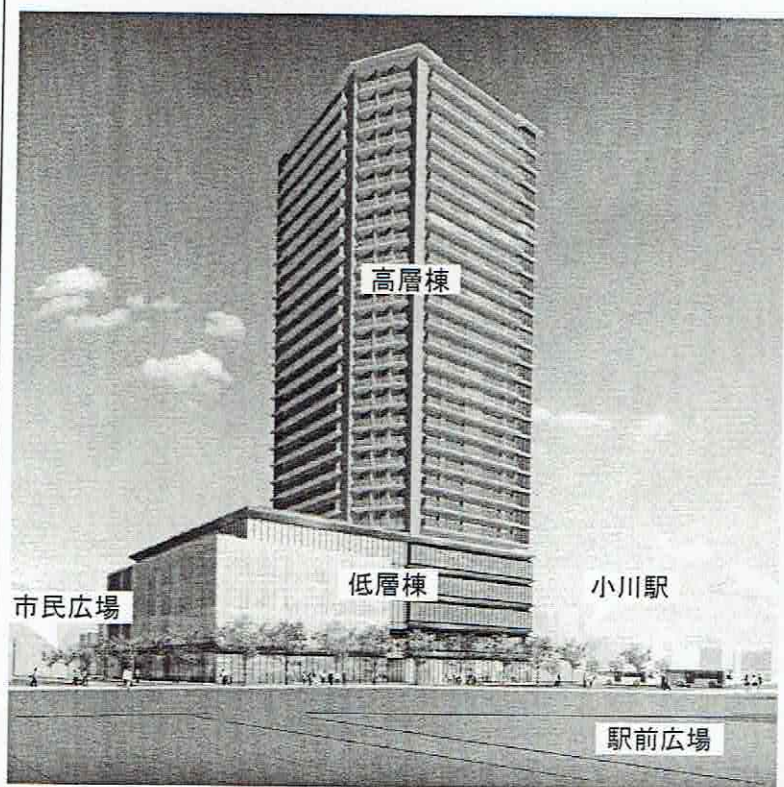
イメージパース (南西より)